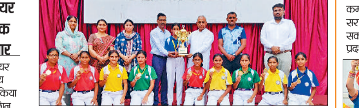
आनंद स्कूल फॉर एक्सिलेंस, मिलकपुर में खिलाड़ियों व छात्रों का सम्मान