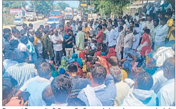
डिगावा मंडी। हत्यारोपियों की गिरफ्तारी की मांग को लेकर रोड जाम कर रहे लोगों को समझाते हुए।

सड़क के दोनों तरफ वाहनों की लंबी लंबी कतारें लग गईं हरिभूमि न्यूज ►► डिगावा मंडी बुधवार तड़के गांव सिंधानी में एक युवती की हत्या के बाद शव मिलने पर ग्रामीण बिफर गए। ग्रामीणों ने हत्यारोपियों की गिरफ्तारी की मांग को लेकर लोहारू-सिधानी रोड को जाम कर दिया। महिलाएं व पुरुष सड़क के बीच में बैठ गए। ग्रामीणों ने जिला प्रशासन के खिलाफ नारेबाजी की। बाद में जाम की सूचना मिलते ही लोहारू पुलिस मौक पर पहुंची। पुलिस ने लोगों से जाम हटाने के लिए कहा, लेकिन प्रदर्शनकारी आरोपियों की गिरफ्तारी पर अड़ गए। बाद में मौके