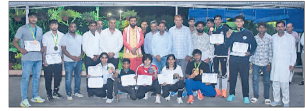
चरखी दादरी। एशियाई कुराश चैंपियनशिप के विजेताओं को पुरस्कृत करते मुख्यमंत्री नायब सिंह सैनी।

एसडीएम मौक पर पहुंचे ग्रामीणों के नहीं मानने के बाद एसडीएम मौक पर पहुंचे और उन्होंने जल्द आरोपियों को तलाश करवा कर गिरफ्तार करवाए जाने का आश्वासन दिया। साथ ही पुलिस ने अभी तक एकत्रित किए गए सीसीटीवी कैमरों की फुटेज को लोगों के समक्ष दिखाया और जल्द आरोपियों तक पहुंचने का भरोसा भी दिलाया। एसडीएम व पुलिस के आश्वासन के बाद प्रदर्शनकारी जाम खोलने को राजी हुए। प्रदर्शनकारियों ने चेतावनी दी कि अगर जल्द आरोपी गिरफ्तार नहीं किए गए तो वे फिर से इसी मार्ग पर उतरने को मजबूर होंगे। सूचना दी। सरपंच की सूचना पर पुलिस मौके पर पहुंची और शव को कब्जे में लेकर पोस्टमार्टम के लिए अस्पताल में रखवा दिया। इस दौरान गांव सिंधानी के बस अड्डे पर अनेक लोग एकत्रित हो गए। लोगों ने लकड़ी व पत्थर डालकर वाहनों को रोकना आरंभ कर दिया। इस दौरान लोग सड़क के बीच में भी बैठ गए। जाम लगने की वजह से वाहनों का आवागमन पूरी तरह से बंद हो गया। सड़क के दोनों तरफ वाहनों की लंबी लंबी कतारें लग गईं। जाम की सूचना मिलते ही पुलिस मौके पर पहुंची। पुलिस ने लोगों से जाम खोलने के लिए कहा, लेकिन प्रदर्शनकारी हत्यारोपियों की गिरफ्तारी तक रोड जाम न खोलने की बात पर अड़ गए।