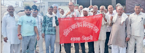
भिवानी। खाद की मांग को लेकर प्रदर्शन करते हुए।