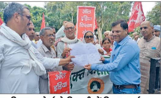
संयुक्त किसान मोर्चा ने मिवानी में किया प्रदर्शन

दिखाता है। कथा सुनने के लिए बड़ी संख्या में श्रद्धालु राजपूत धर्मशाला में एकत्रित हुए। इस दौरान भजनों और कीर्तनों का आयोजन किया, जिसमें सभी ने उत्साहपूर्वक भाग लिया। कथा 17 अगस्त तक चलाई तथा 18 अगस्त को हवन व भंडारे के साथ समापन होगा।