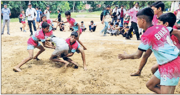
भिवानी। कबड्डी मैच में अंक लेने के लिए रेडर को पकड़ते हुए व खो खो मैच में अंक लेने का प्रयास करते हुए व खिलाड़ियों का परिचय लेकर मैच शुरू करवाते हुए।